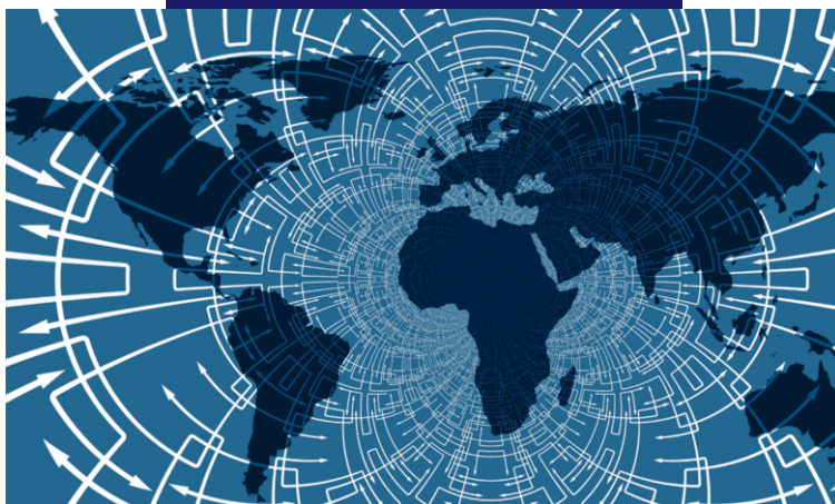
Table of Contents

Office of Vice-Chancellor for Global Strategies and International Affairs